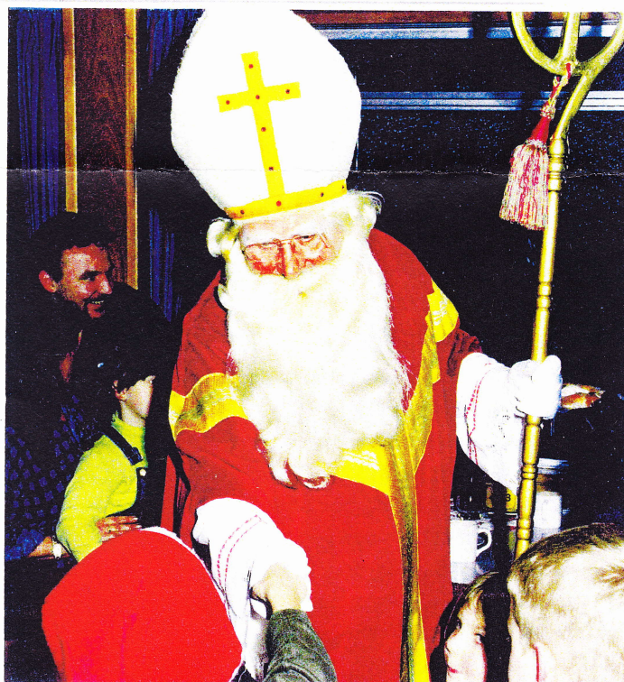
Nikolaus auf Hafenrundfahrt Duisburg 2000

Mittelalterliche Binnenschiffahrt auf der Ruhr. DACHSTUDIO !!!